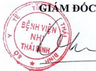
Lương Đức Sơn